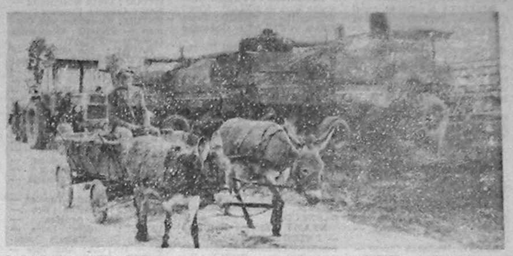
Sansele agriculturii, astăzi

Camera Deputaților a înscris pe ordinea de zi, la deschiderea „stagiunii de toamnă” continuarea dezbaterilor la proiectul Legii privind măsurile premergătoare situației juridice a unor imobile trecute în proprietatea statului după 6 martie 1945.