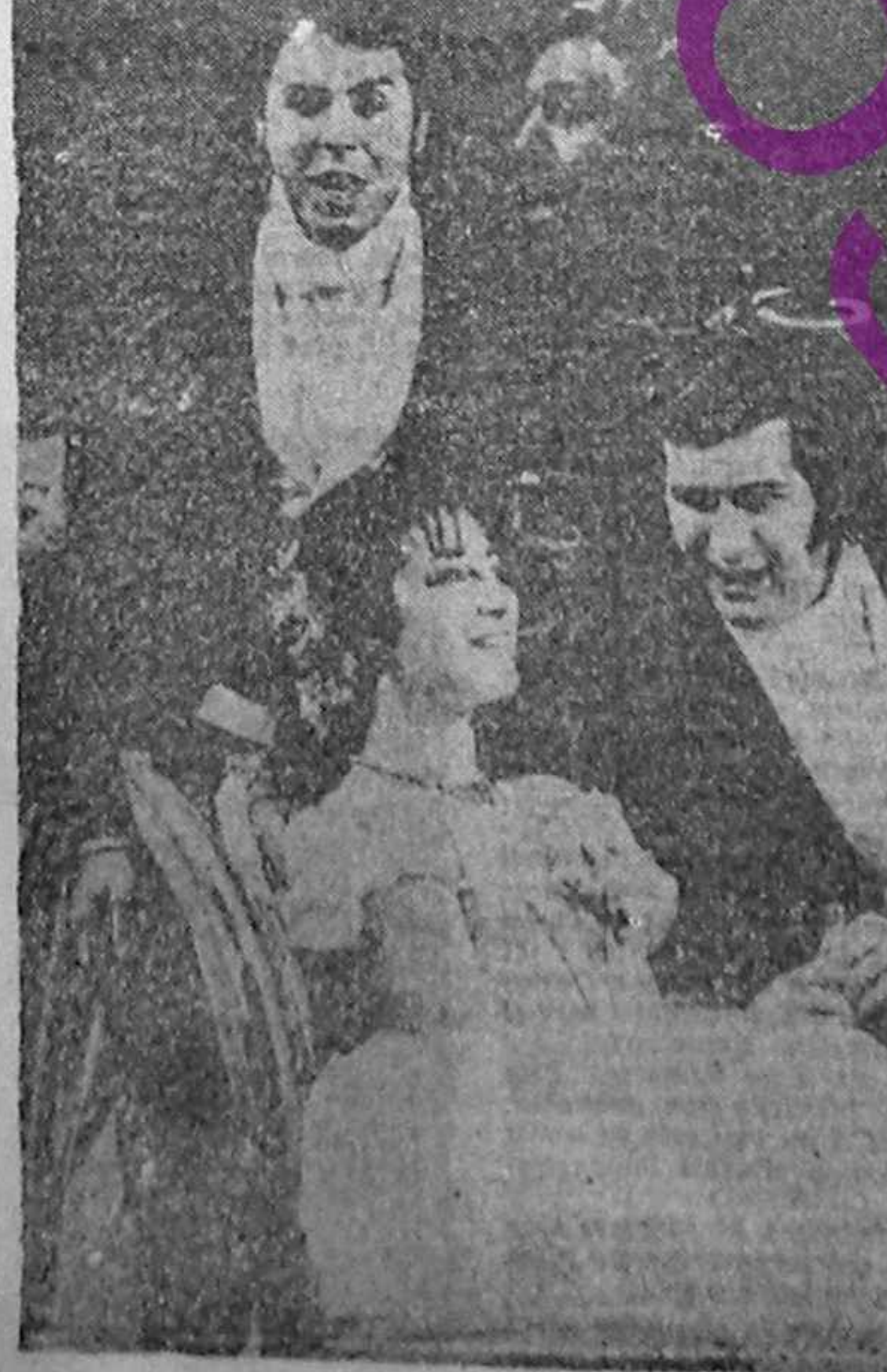
„Traviata” la Scala, după 26 de ani

RICARDO MUTI — directorul muzical — din 1986 — al operii Scala din Milano s-a decis acum trei ani să pună în scenă „Traviata” de Verdi. De 26 de ani această operă nu se mai jucase pe scena cre-