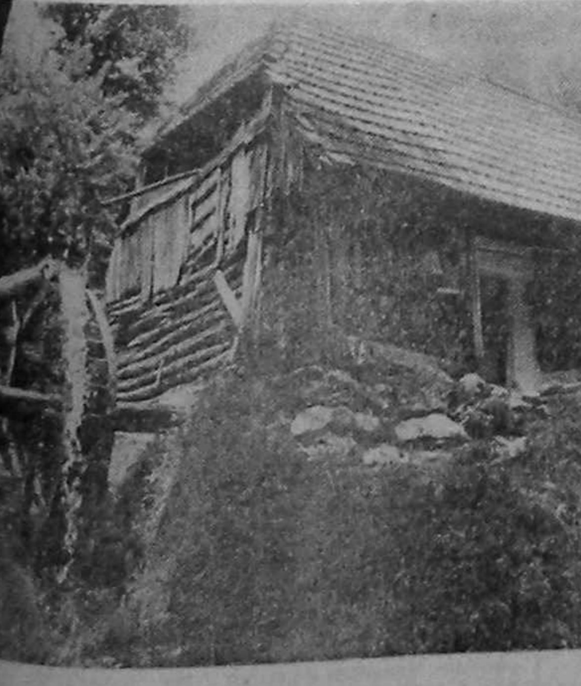
Din cauza izolării de adevăr oamenii satelor n-au putut sesiza formele mascate de comunism din propaganda electorală a celor îmbrăcați în haine de democrați.

IONEL D. STRĂMBU (Continuare în pag. a 3-a)