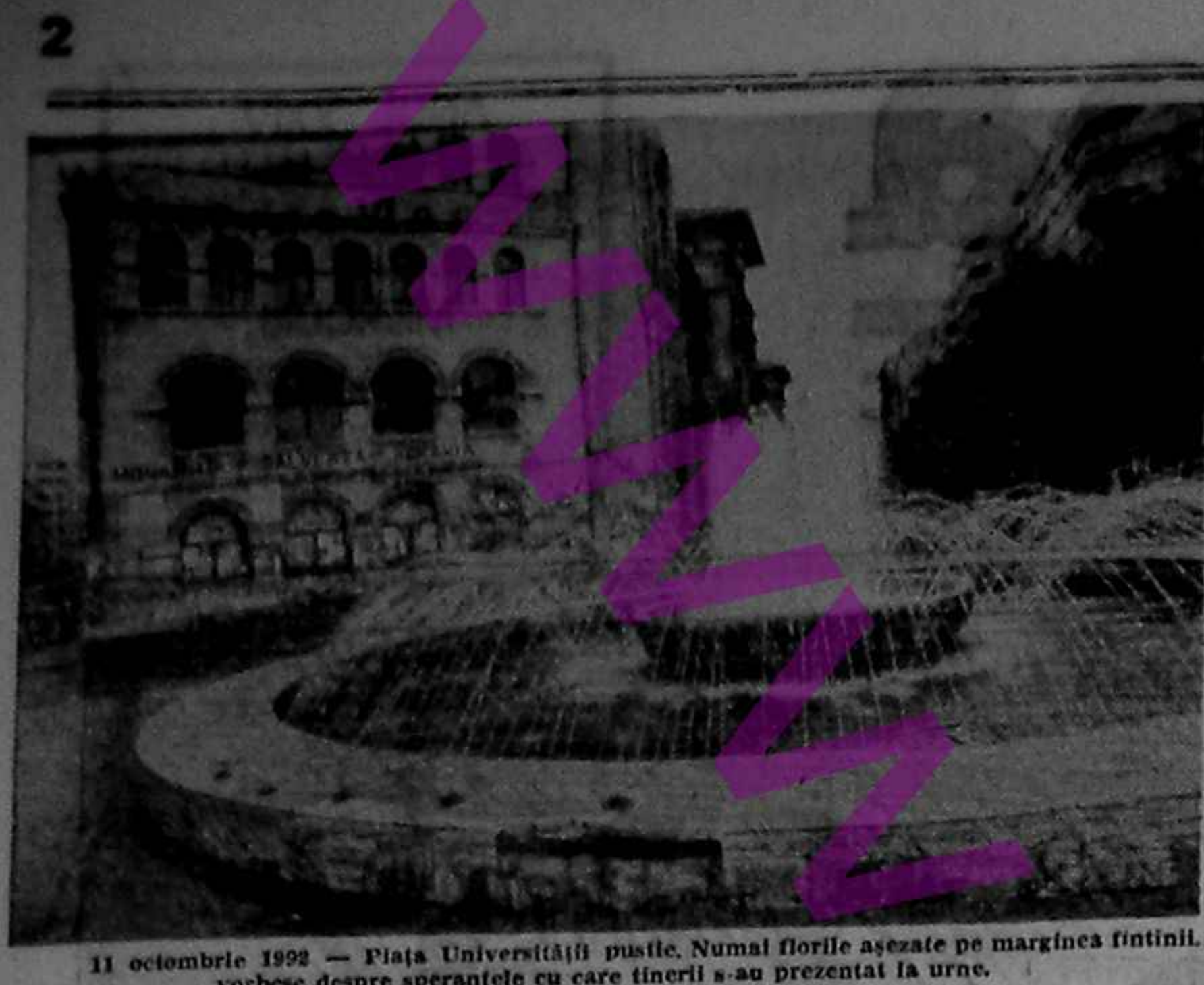
11 octombrie 1992 - Piața Universității pustie. Numai florile așezate pe marginea fântinii, vorbesc despre speranțele cu care tinerii s-au prezentat la urne.