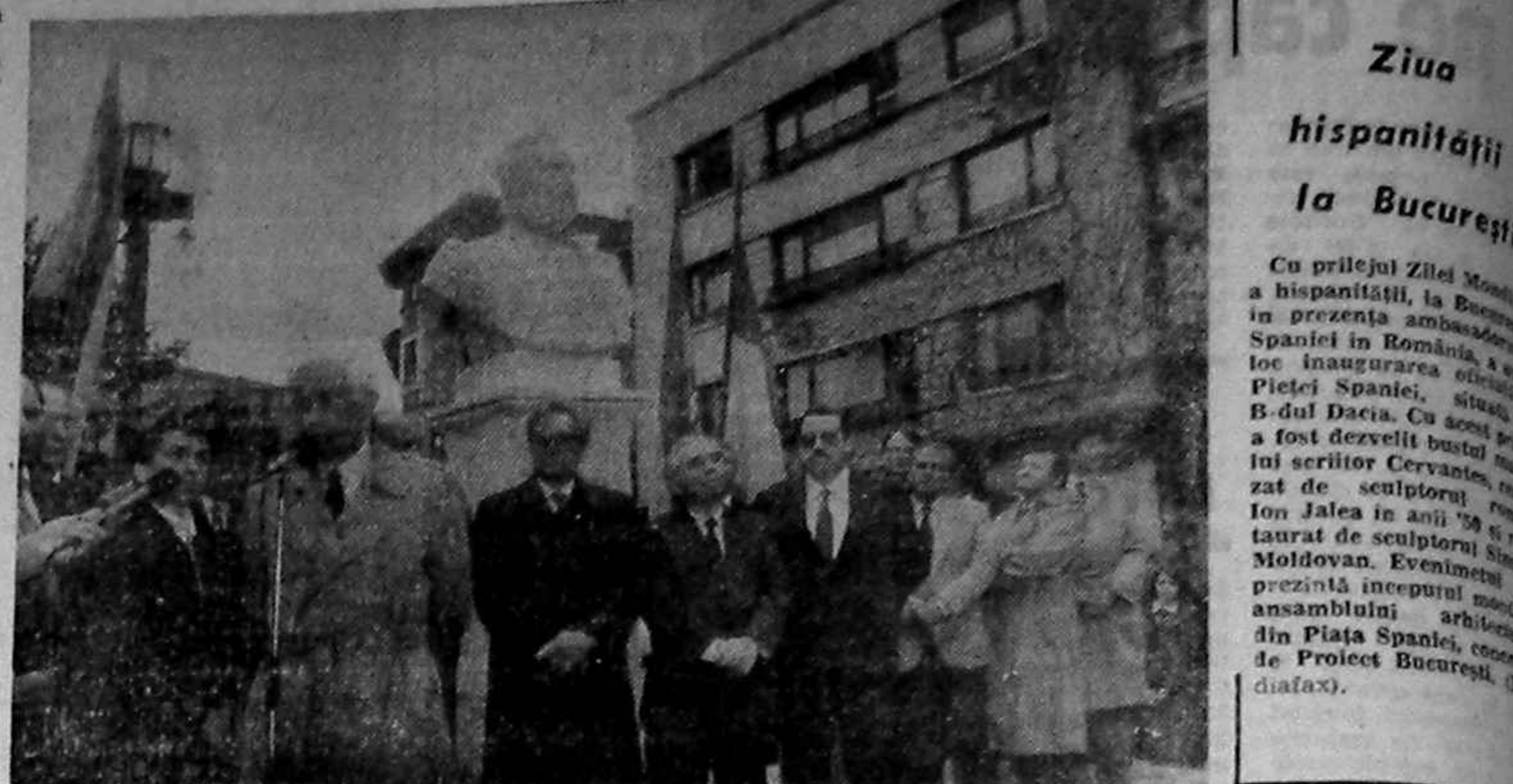
Ziua hispanității la București... Cu prilejul Zilei...