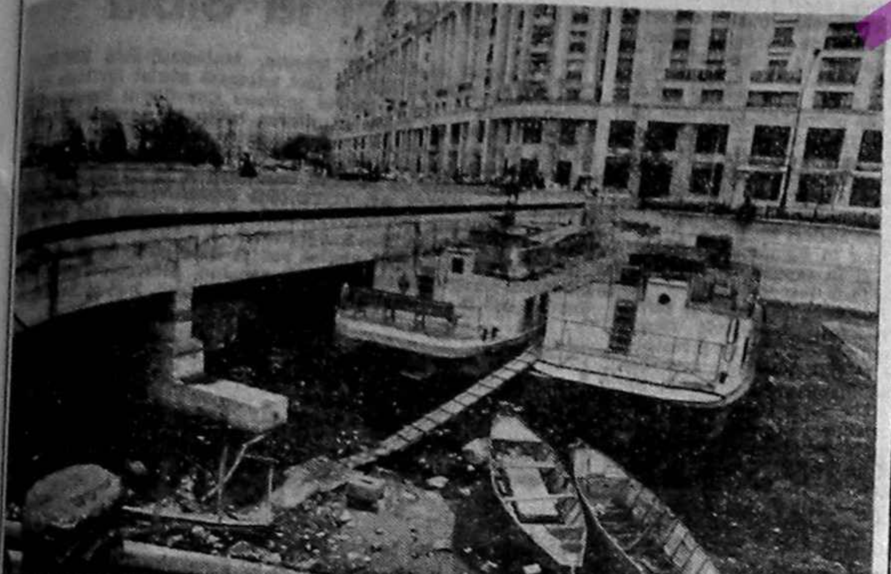
București și port (fedesenist) la Marea Neagră.