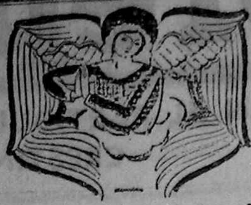
Sub semnul credinței