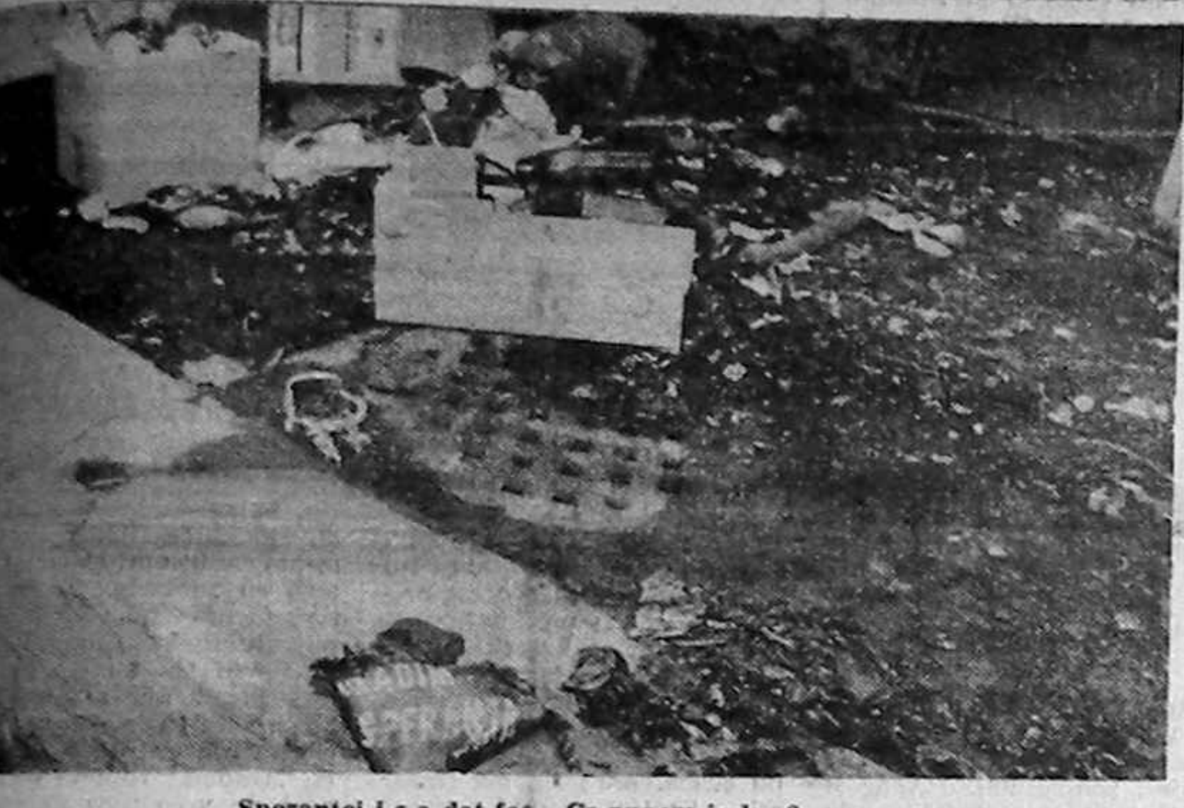
Speranței i s-a dat foc... Ce punem în loc?

DL. STOLOJAN: A cere numărătoarea paralelă, e a fi paranoic Domnul Theodor Stolojan, care s-a bătut cu pumnii în piept, luni în șir, că dorește alegeri corecte, găsește acum că numai nebunii pot cere un control al numărării voturilor. Grosolan, domnul prim-ministru îndrăznește să-i pună pe marii democrați (de azi, dar și de ieri) în rimă cu Ceaușescu. În ziua celui de-al doilea tur de scrutin, după ce votase, domnia sa a declarat presei: Drumul spre paranoic nu trece numai prin Ceaușescu, drumul spre paranoic trece și prin: „Hai să-l controlăm pe fiecare, să numărăm și noi, să numere și alții...”