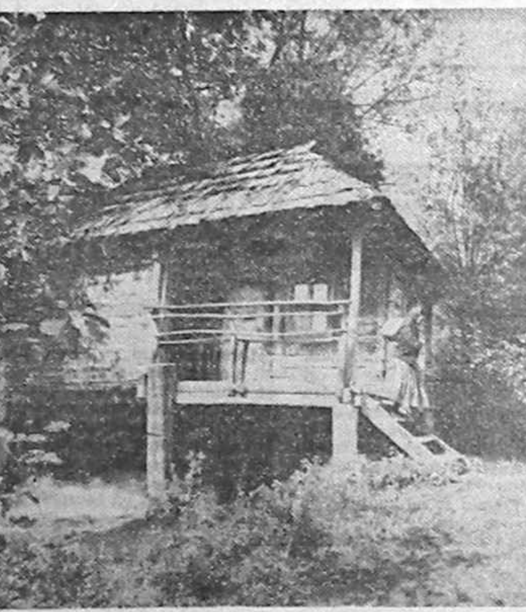
Fiindcă tot veni vorba de prețul piinii...

BATMAN REVINE 27-30 oct. - Sata Palatului (tel. 14.73.72), ora 17.00.