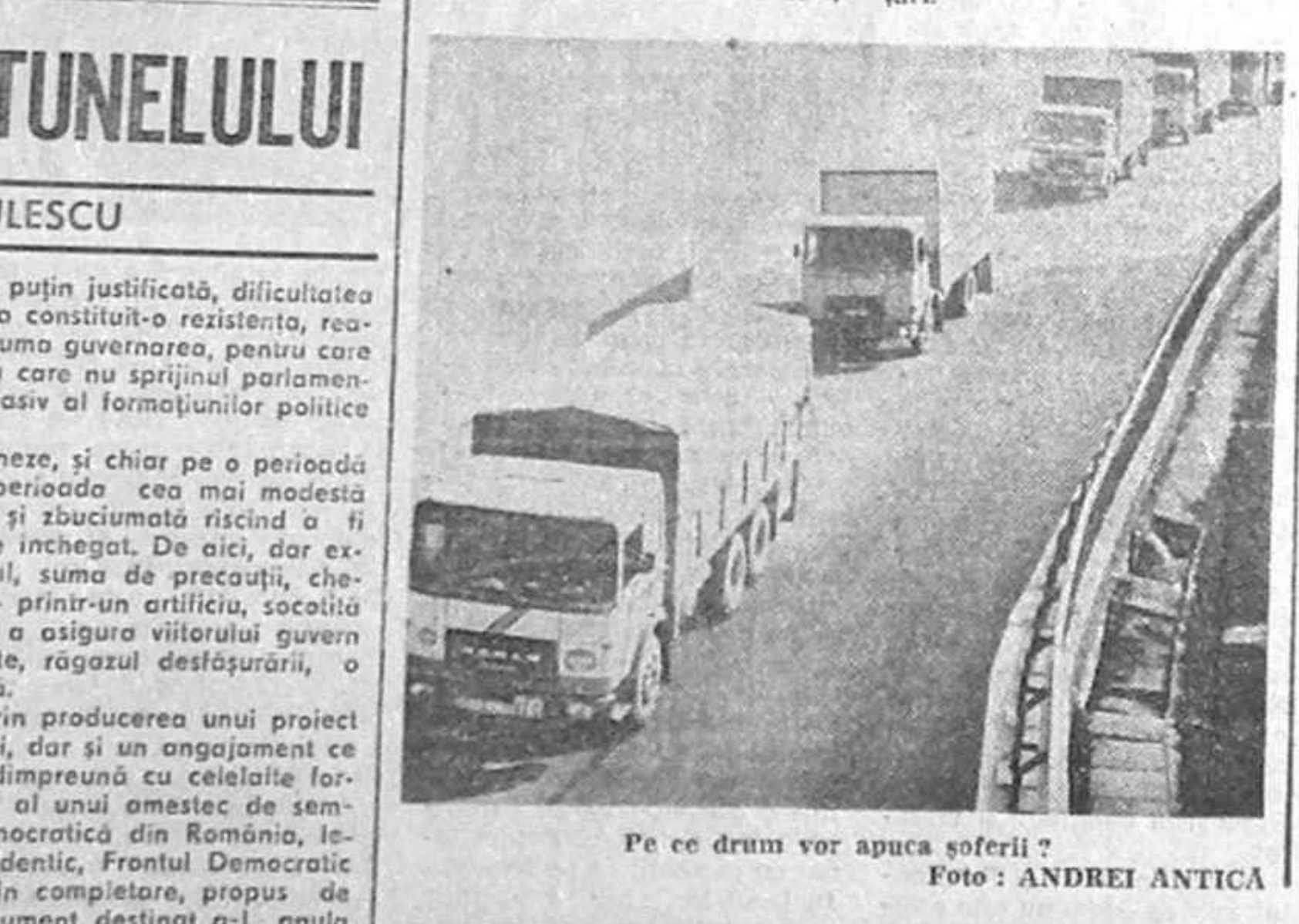
Pe ce drum vor apuca șoferii?