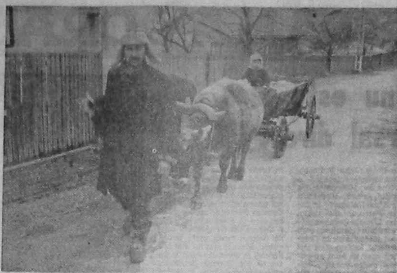
Statul incurajează achiziționarea de mașini agricole