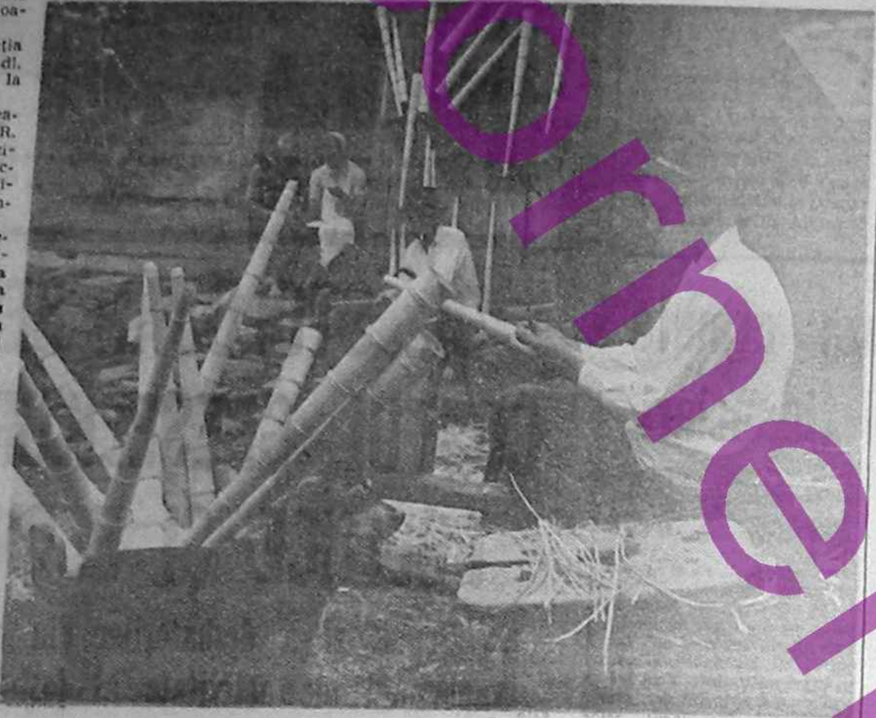
„Rezervele spirituale ale românilor au fost păstrate“