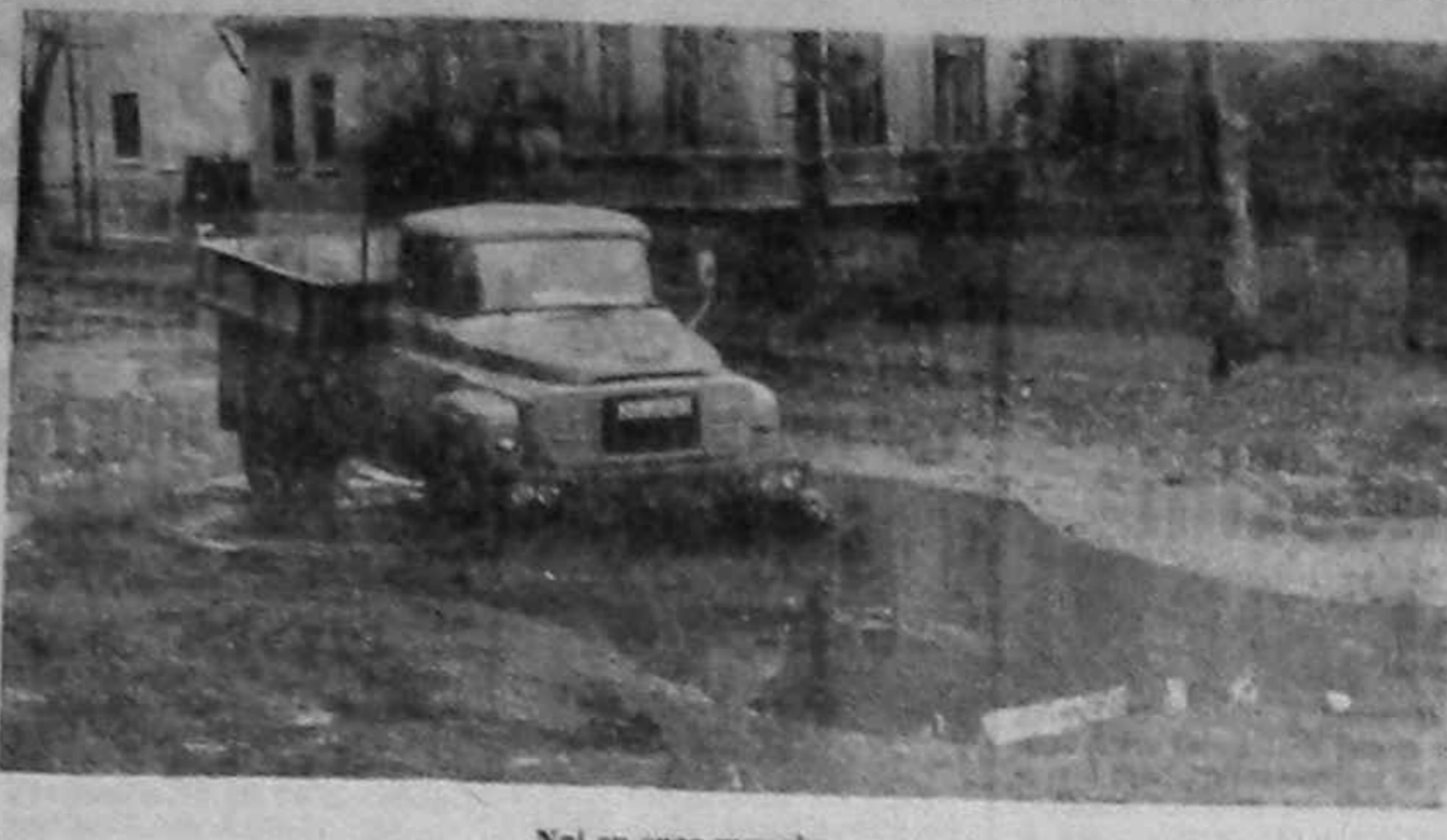
Noi cu spor muncim...