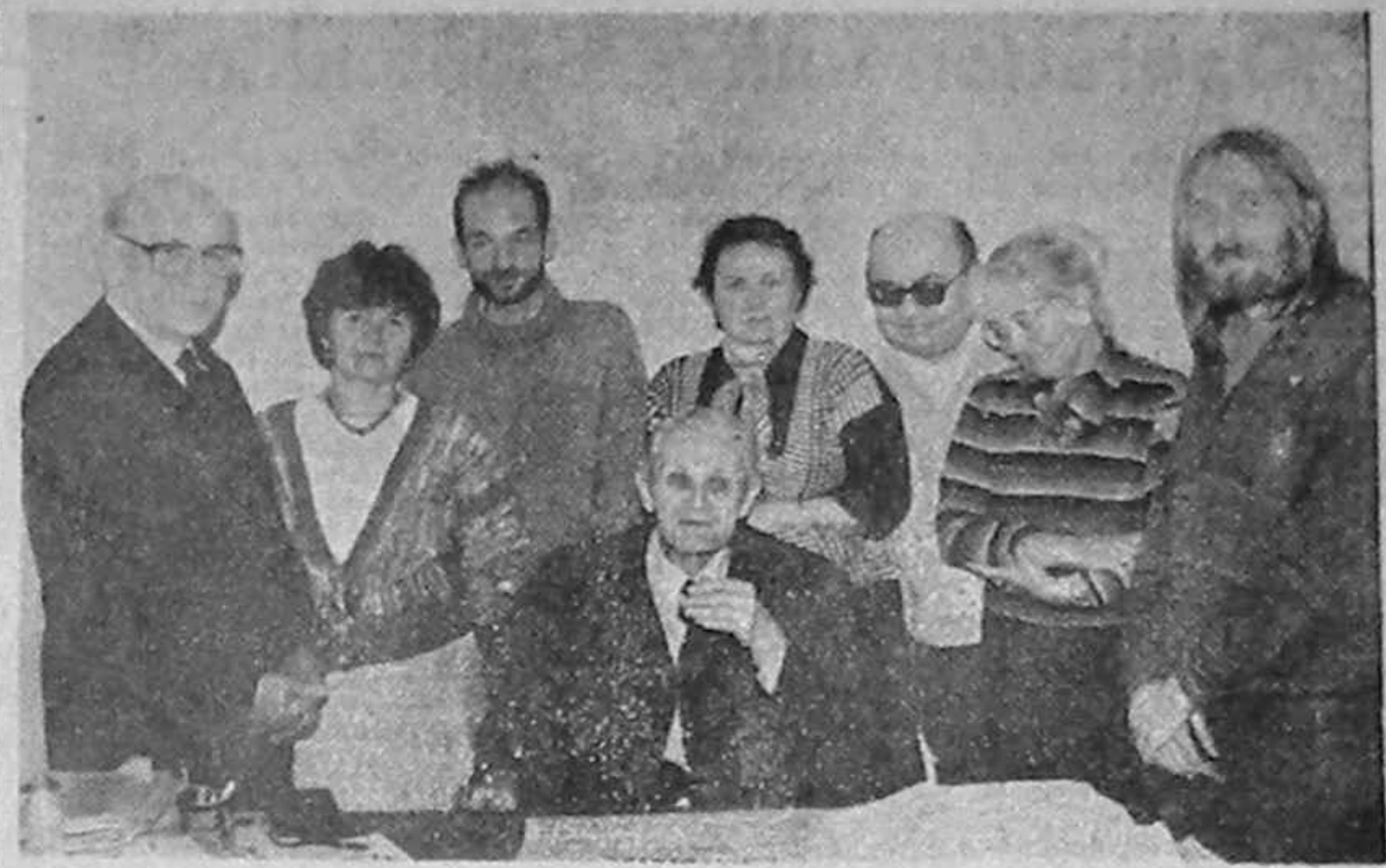
Dr. Corneliu Coposu a vizitat recent „Dreptatea”. Într-o atmosferă destinsă, președintele PNTCD s-a întreținut cu redactorii șiceilalți angajați, mulțumindu-le pentru activitatea pe care o depun.

Pe fondul tensiunilor sociale și al guvernării ineficiente care au dus la scăderea intolerabilă a nivelului de viață în România în ultimele săptămîni a fost avansată în Consiliul Național Consultativ sindical — organism din care fac parte cele trei mari centrale sindicale „Alfa”, „Frăția