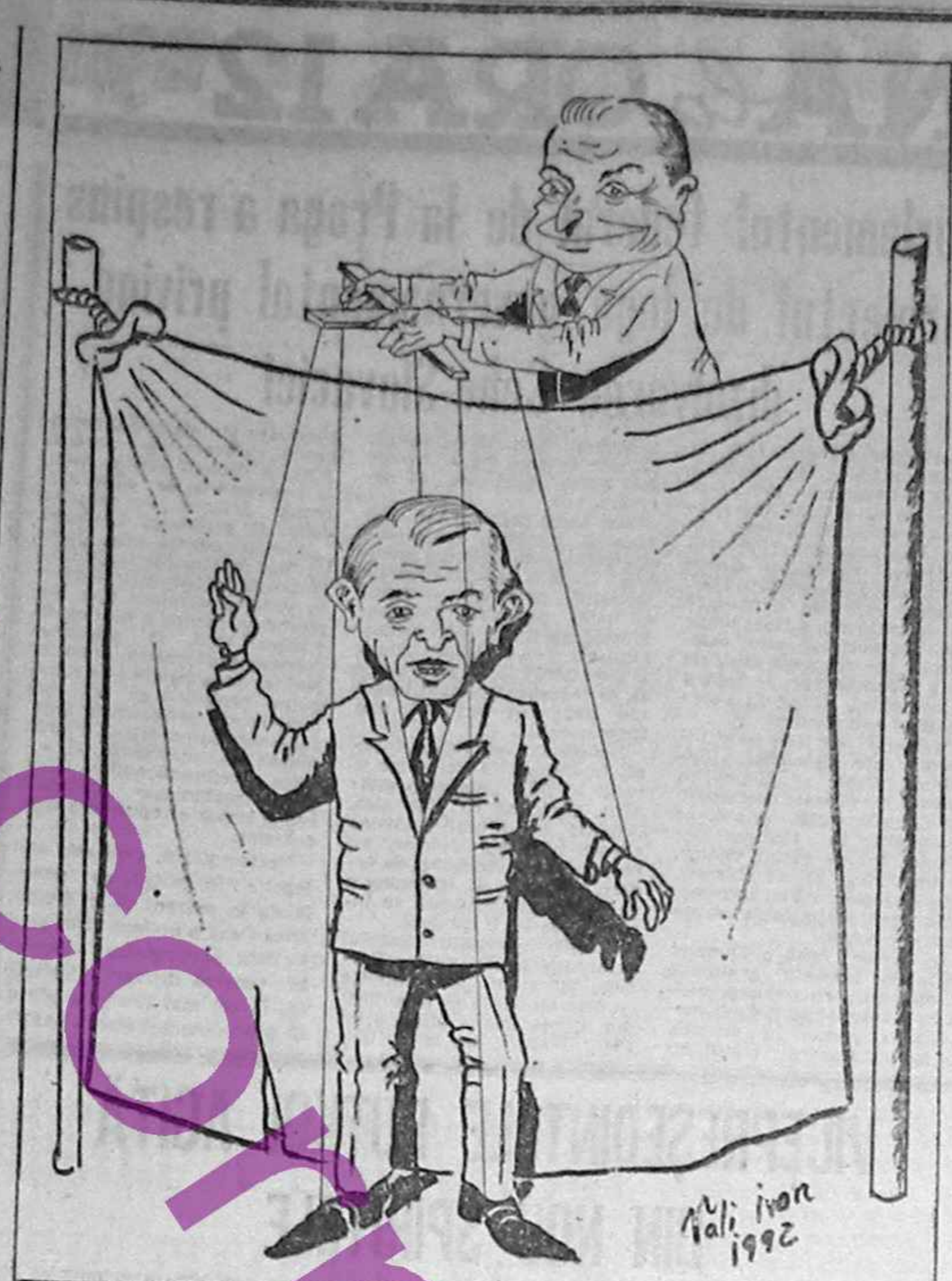
Premiera spectacolului a avut loc joi, în ședința celor două Camere reunite

Facultatea de Mecanică Condițiile concursului se afișează după rezultate