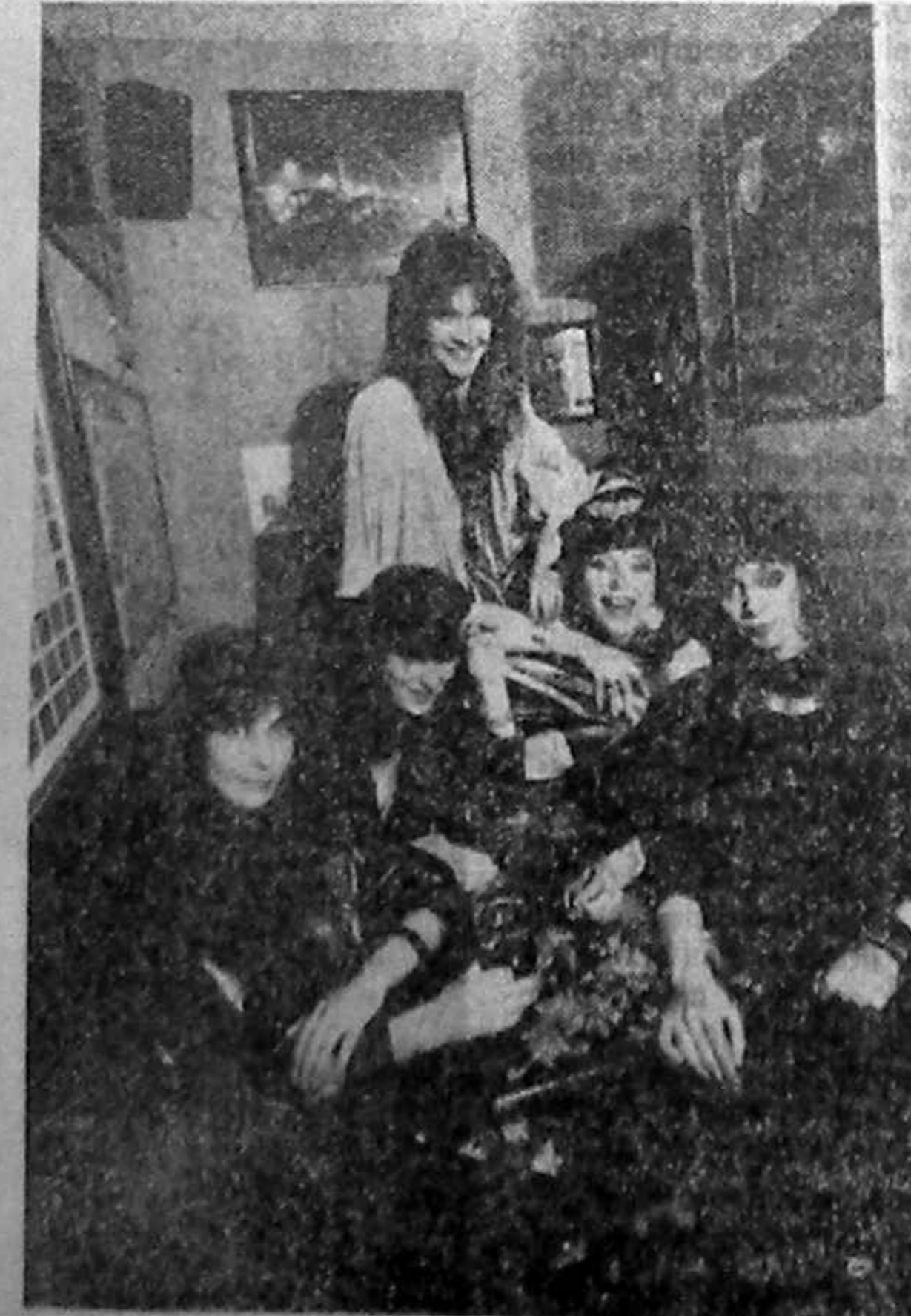
Grupul „SECRET” în componența actuală

unde candidații sînt în număr redus? „Într-o astfel de țară este foarte greu să fii conștient de vocația ta...”