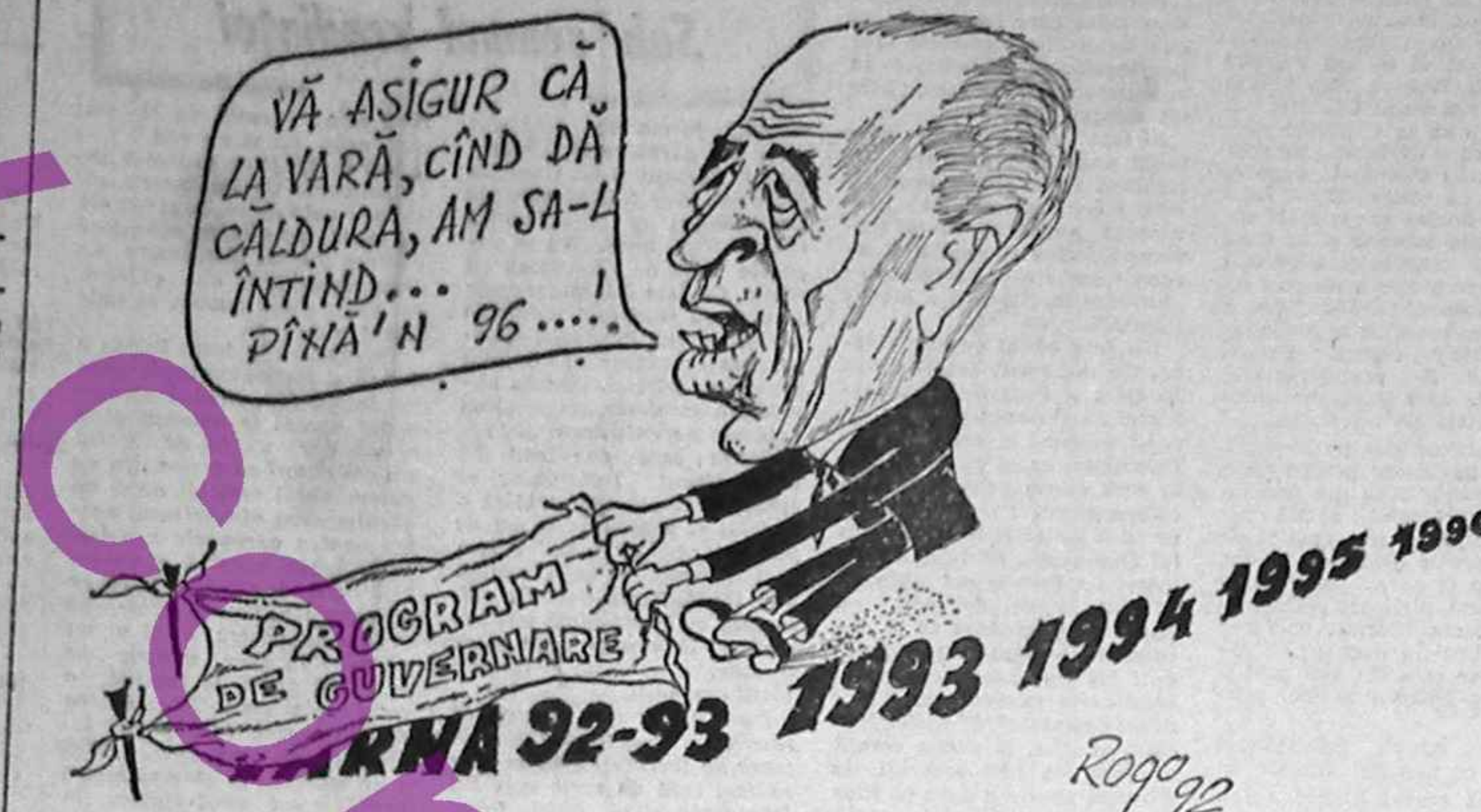
Deși nu a prezentat Parlamentului un program de guvernare pe patru ani, guvernul Văcăroiu a primit votul de investitură

Fenomenul, cu multiple fațete, s-a tot repetat și se perpetuează încă. Nașterea laborioasă a unui guvern urmînd alegerilor de la 27 septembrie și 11 octombrie, a putut părea multora simptomul unei ezitări, în lipsa acelei solide majorități care să asigure lunga viațuire a formațiunii cîștigătoare. Diverse alte soluții, puse înainte, au lăsat impresia că se caută, în principal, o formulă de compromis, în vederea realizării unei majorități parlamentare robuste. Deci, o împărțire rezonabilă a Puterii, pe sectoare infra și intragovernamentale. Nici vorbă de așa ceva!