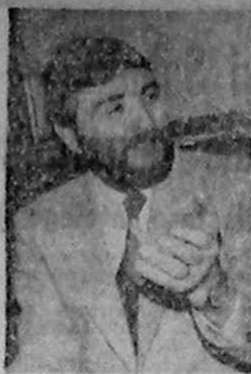
Constantina Tutunaru, primarul sectorului 3 al Capitalei