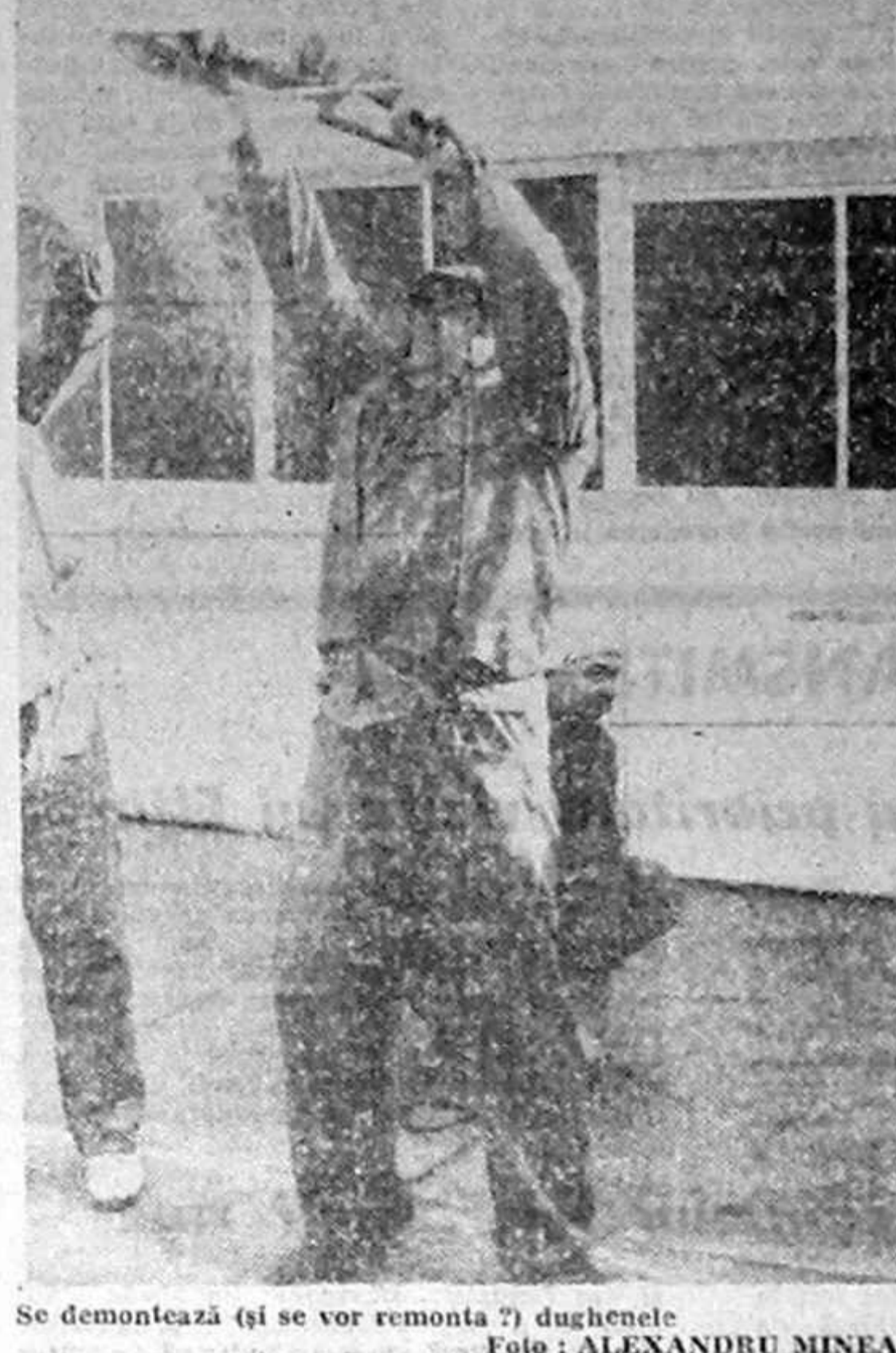
Se demontează (și se vor remonta?) dughenele.

După cum anunță surse bisericești, în București la sfîrșit în aceste zile „Caritas”-ul greco-catolic. Patronată de Biserica Greco-Catolică din România, noua societate de binefacere va avea sediul provizoriu la biserica Avhă, cartierul Pufos din Capitală. Cu începere de la Crăciun, „Caritas”-ul greco-catolic va pune în aplicare un program social de ajutorare a celor lipsiți de mijloace materiale. (A.M. PRESS)