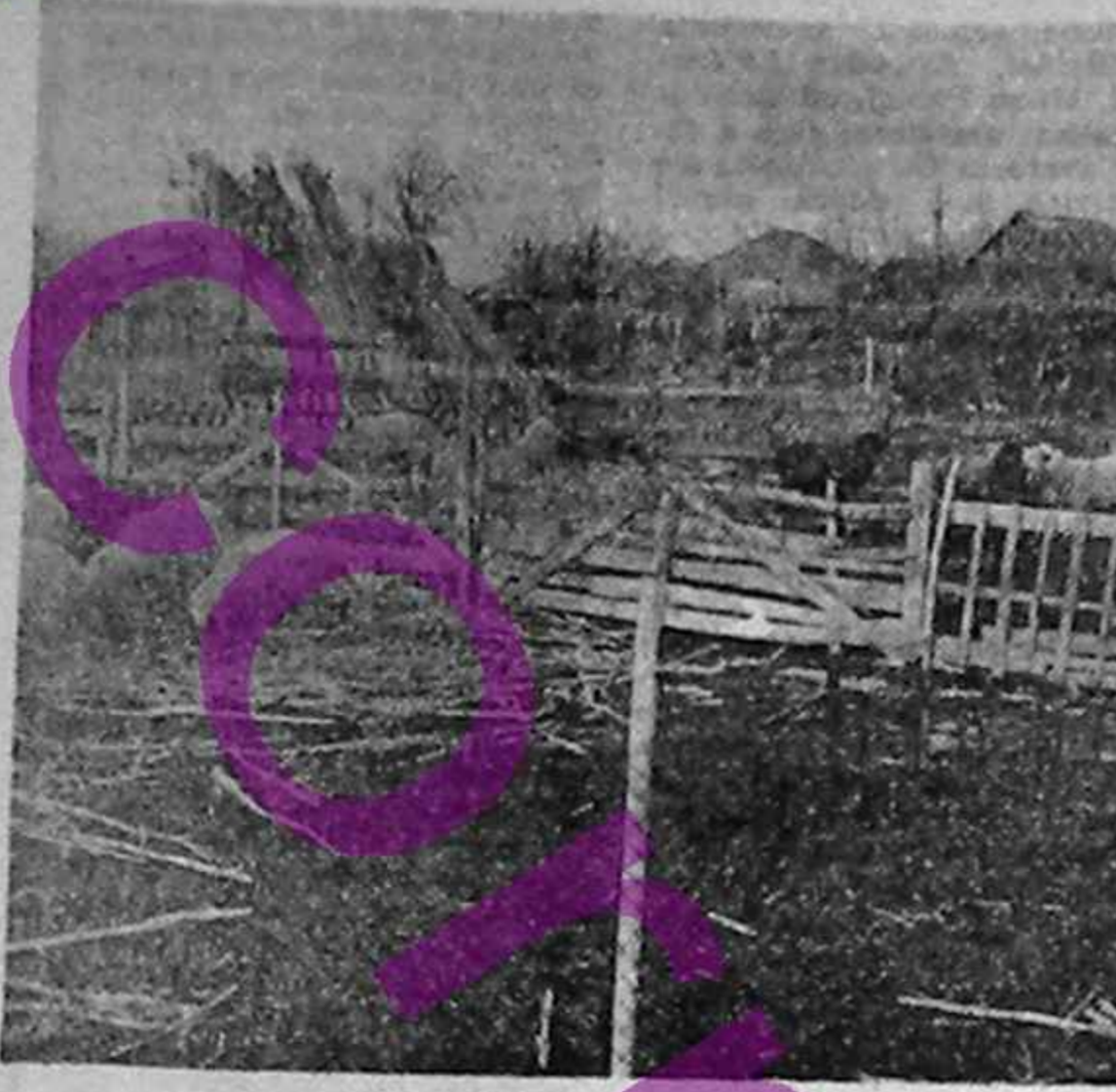
Întinm sau nu în asociație?