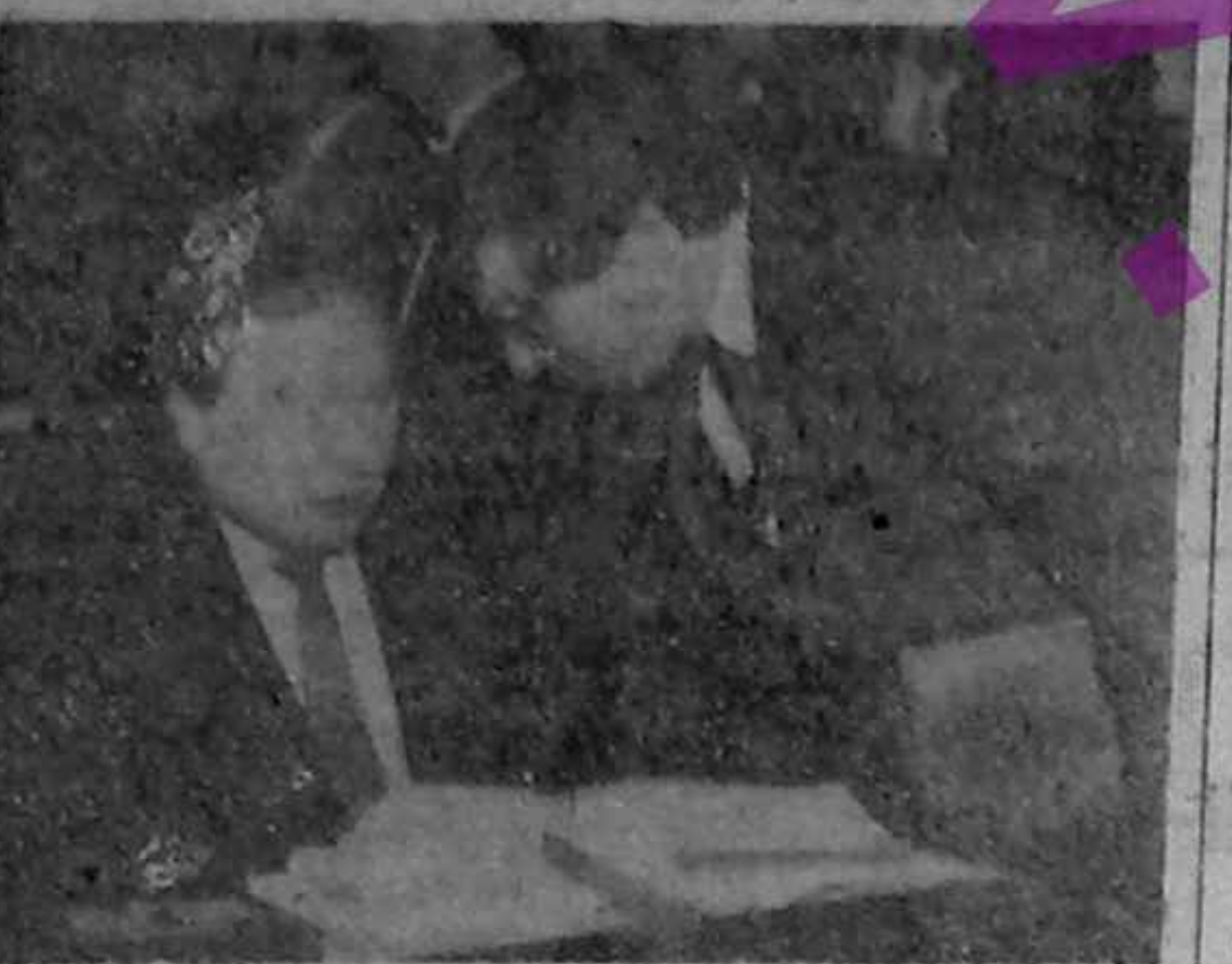
In timpul Congresului Deputatilor, Egor Gaidar se consulta cu ministrul comertului exterior, Aven

Dupa numirea lui Viktor Cernomirdin in functia de prim-ministru al Rusiei, fostul premier Egor Gaidar a declarat ca nu accepta sa faca parte dintr-un guvern condus de acesta.