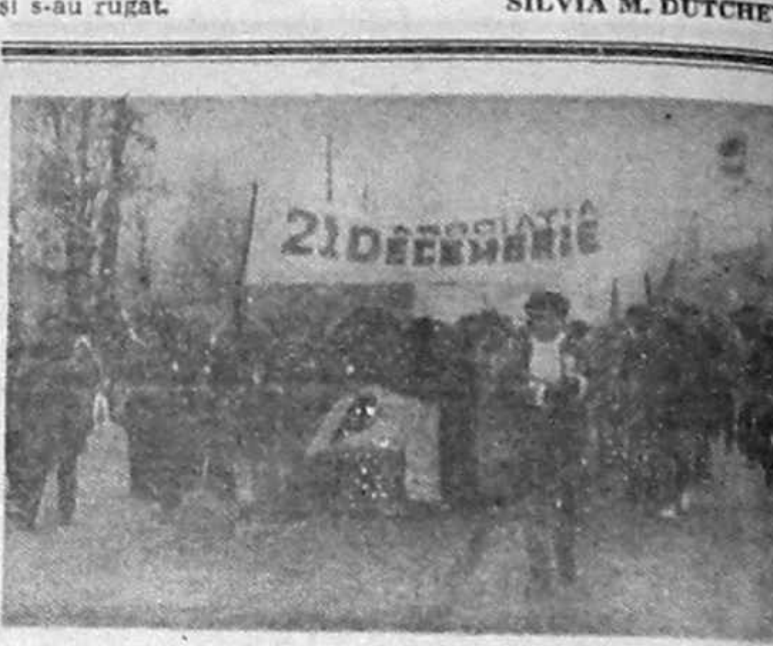
21 DECEMBRIE 1992 — MARȘUL TĂCERII ÎN BUCUREȘTI