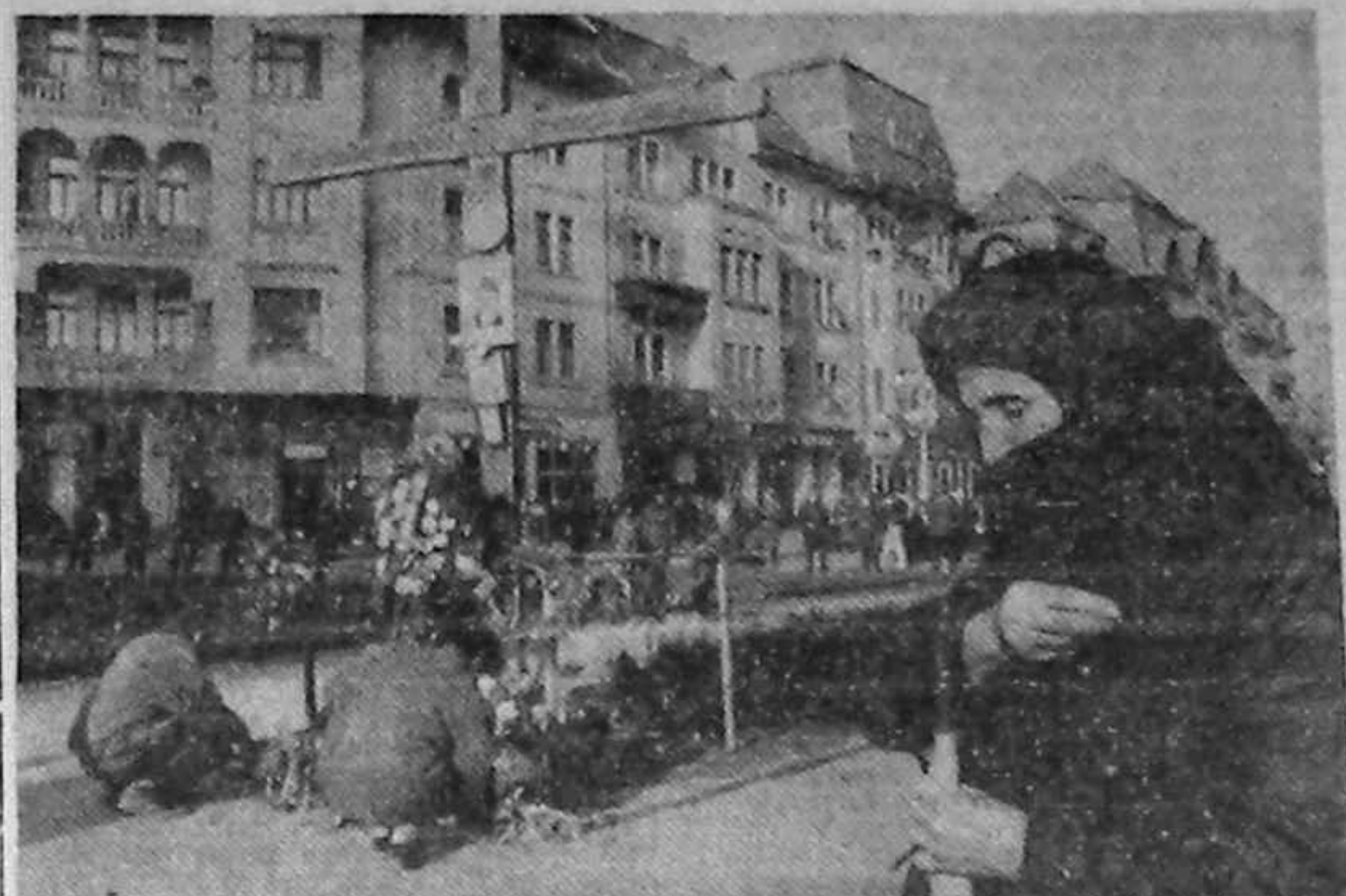
Timișoara — '92