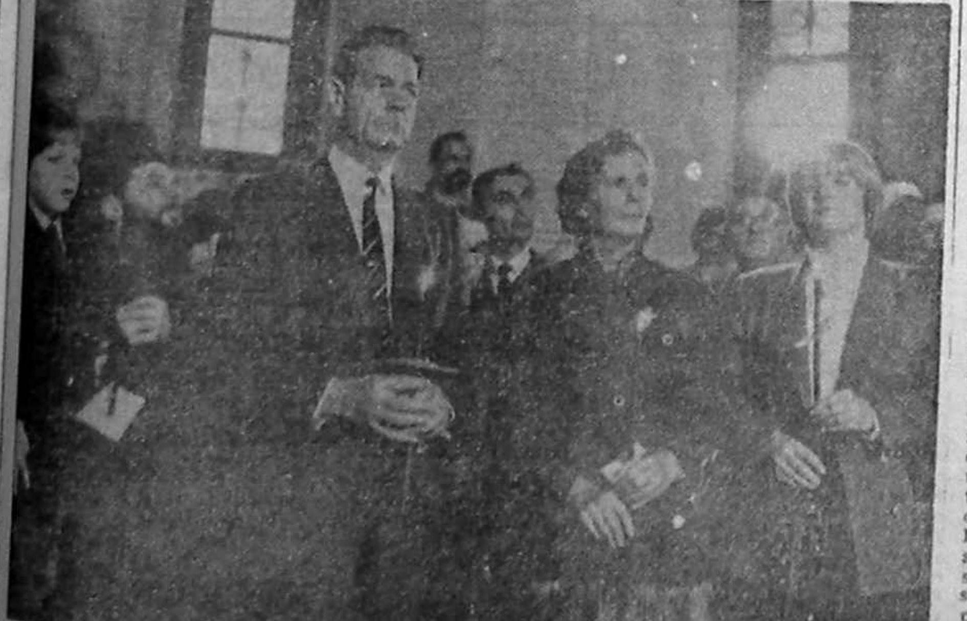
După un Paște fericit, un Crăciun al dezamăgirii leri, la ora prînzului, în fața Catedralei din Timișoara se adunaseră spontan grupuri mari de cetățeni, care își exprimau nemulțumirea față de condițiile umilitoare impuse de oficialitățile române M. S. Regelui