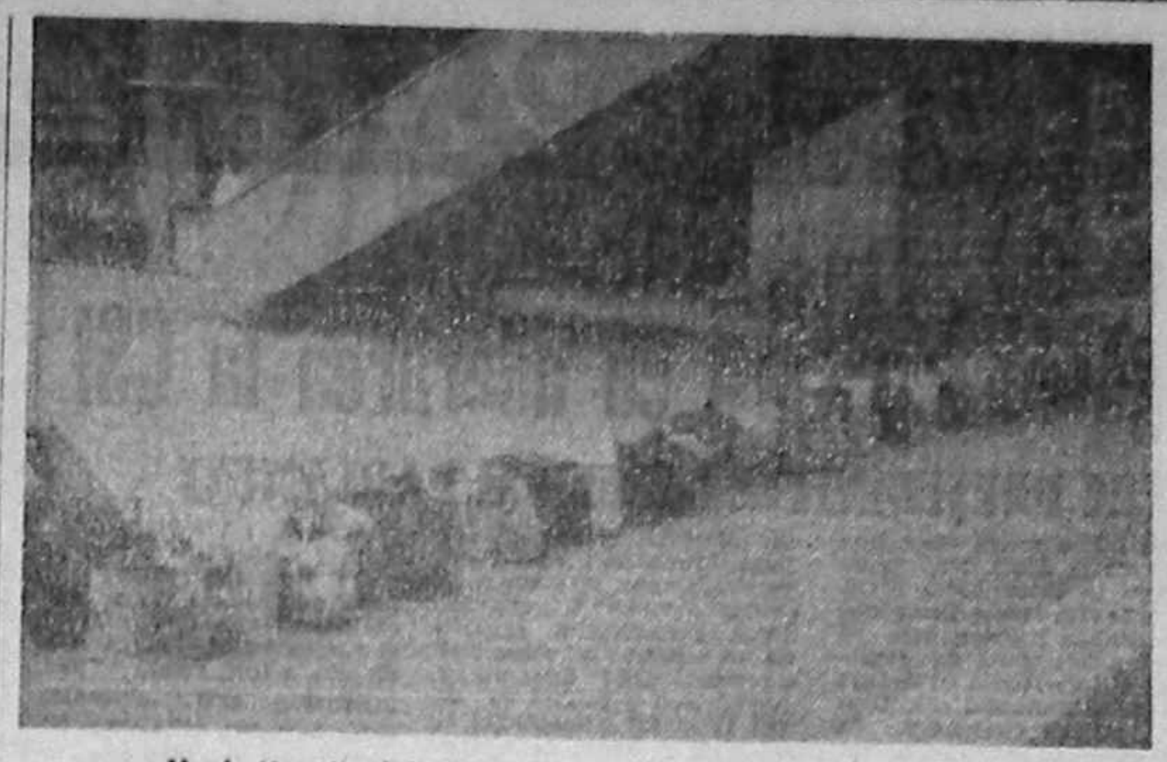
Noul tip de felicitare lansat de guvernul Văcăroiu...