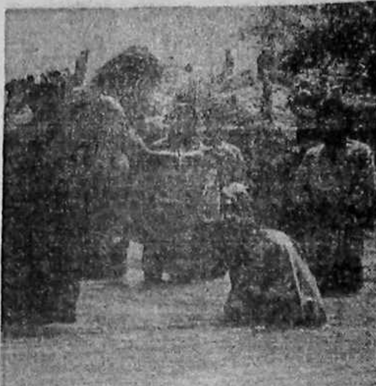
Botezul lui Isus în Iordan, în viziunea regizorului Franco Zeffirelli