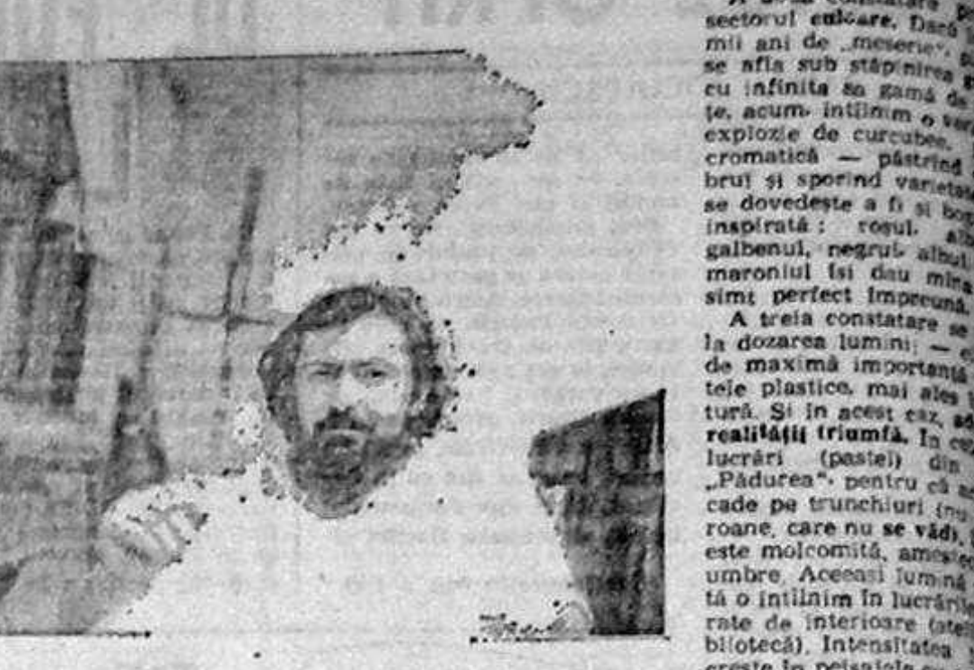
Pictorul Constantin Daradici