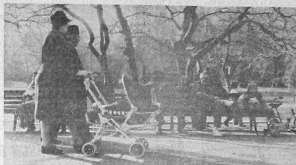
București, sfîrșit de ianuarie...