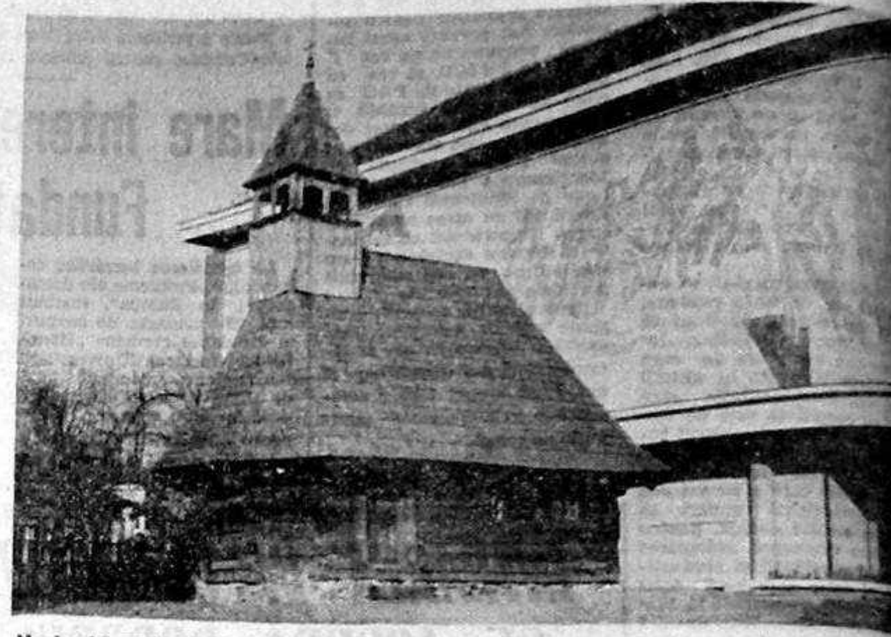
Veche biserică din Transilvania reconstruită pișă cu pișă în curtea Muzeului Ţării Române

Prin intermediul Agenției de Impresariat Artistic Romstar și al Agenției de distribuție din Germania, în perioada 30 ianuarie - 28 februarie, va avea loc o serie de turnee ale Operei Române în orașe din Germania și Austria cu spectacolele „Lăcașul bedelor”, „Carmen”, „Rigoletto”, „Chopiniana” și „De la Plătră”. În perioada 19 aprilie - 19 mai, mai Opera Română va avea un turneu în Germania cu spectacolul „Italiana din Alger” de Rossini, iar în luna mai va participa la Festivalul Internațional de Canto de Londra. (Rompres)