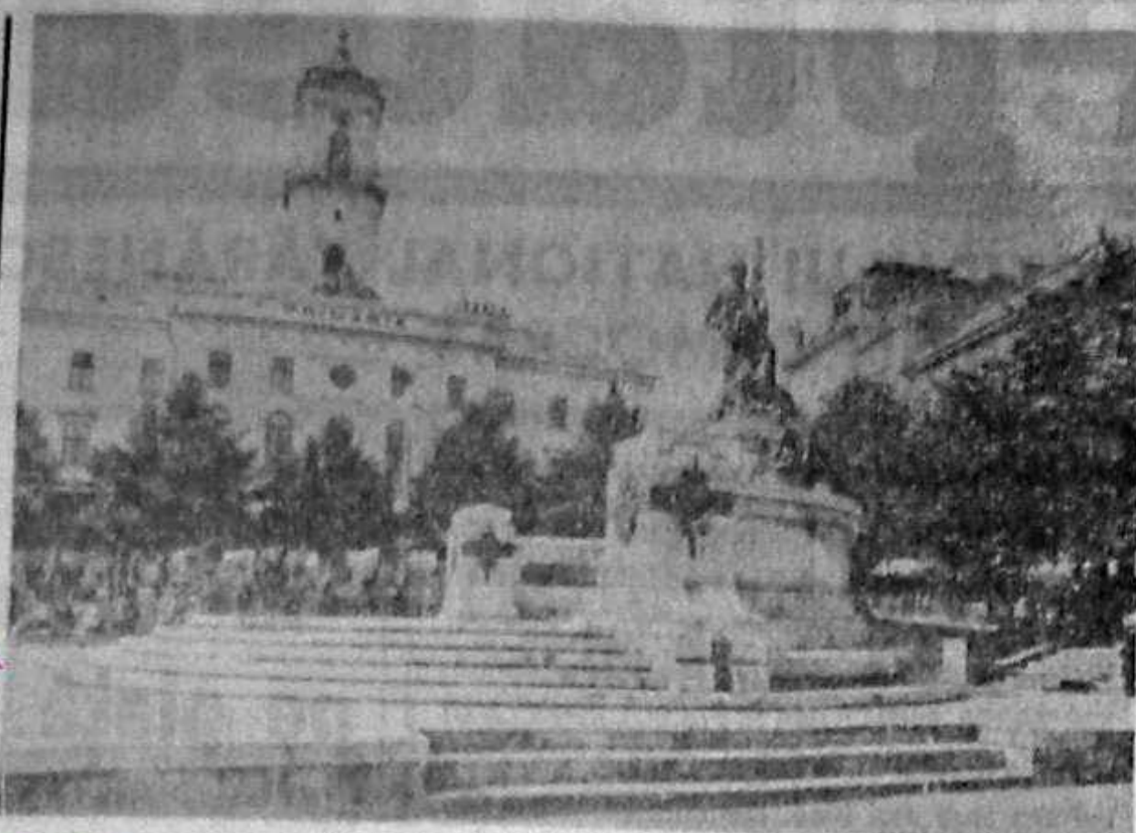
Cernăuți — Primăria și monumentul Unirii