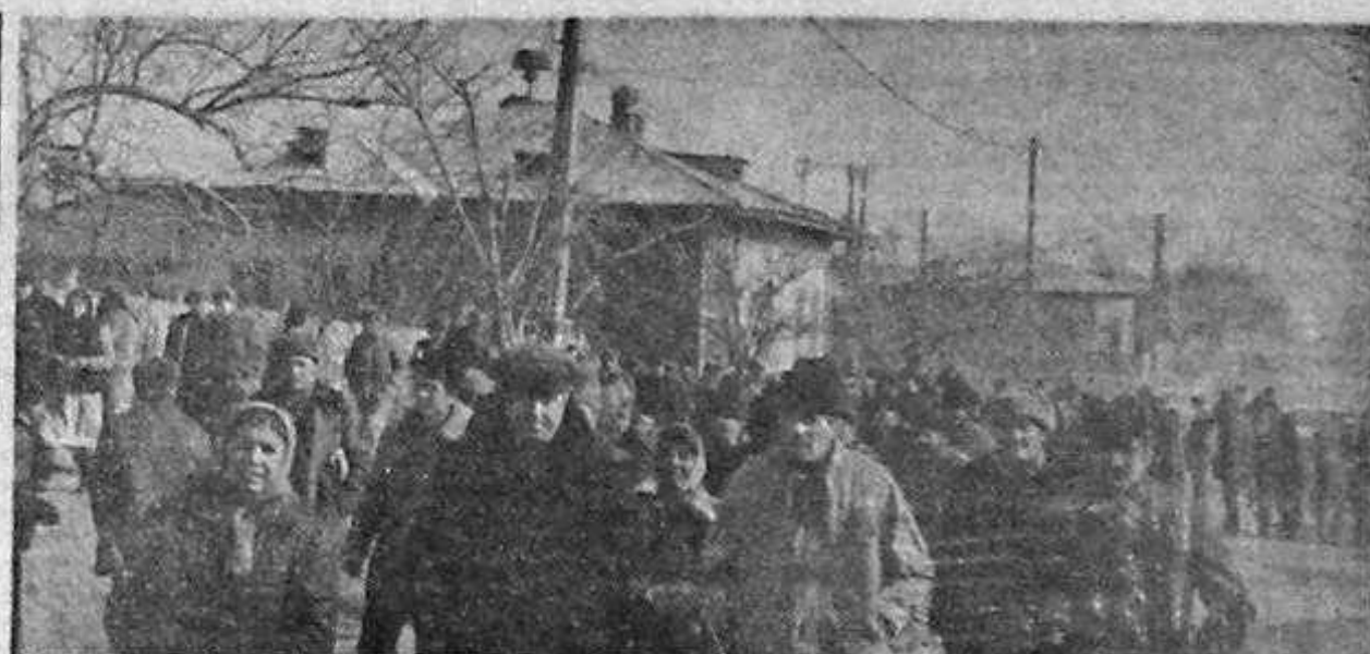
Sătenii din Prundu, ies în întâmpinarea comisiei parlamentare

apariția DREPTĂȚII, pentru un interval de timp pe care îl dorim cît mai scurt.