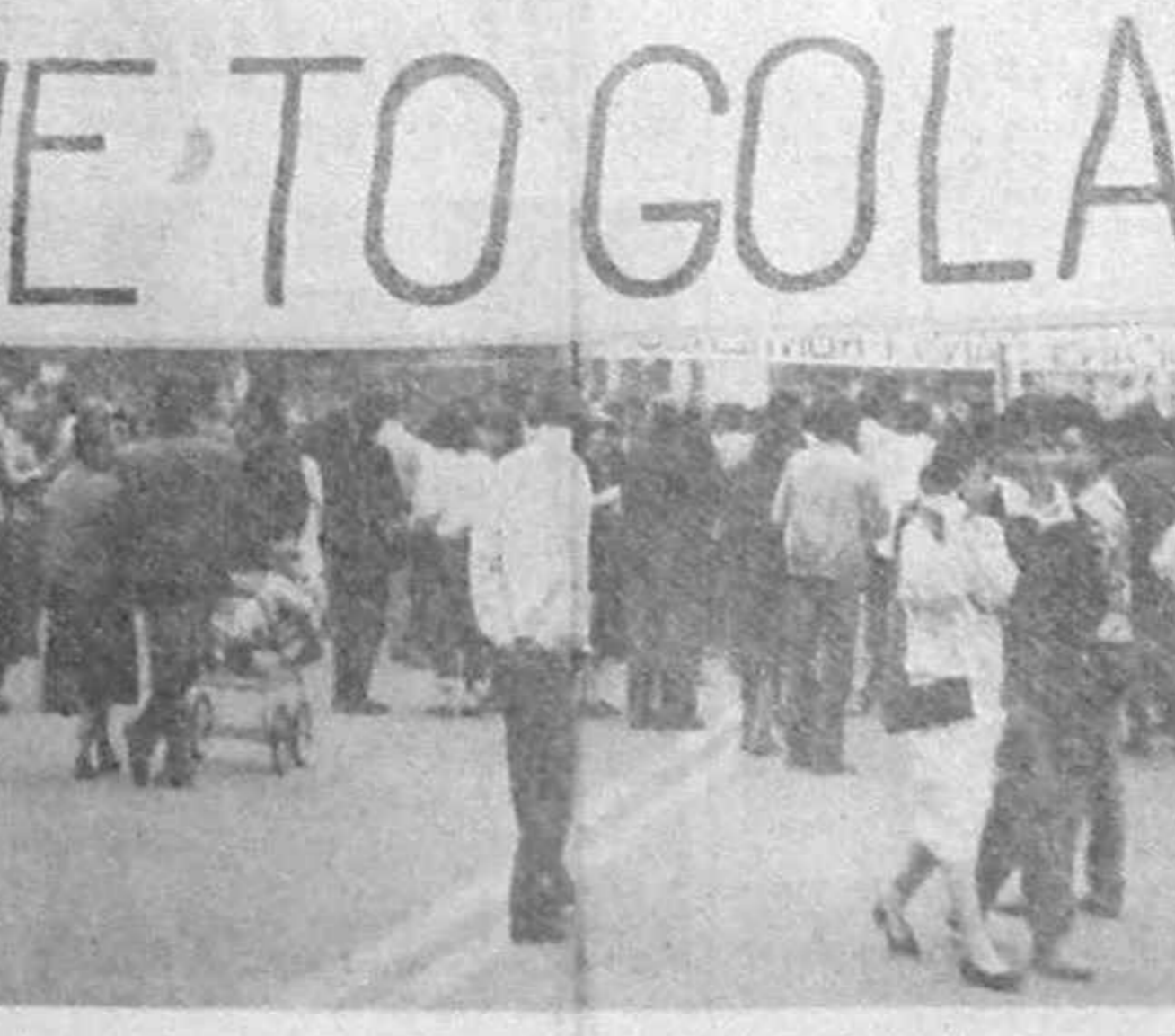
21 mai 1990 - zi de doliu în Golania