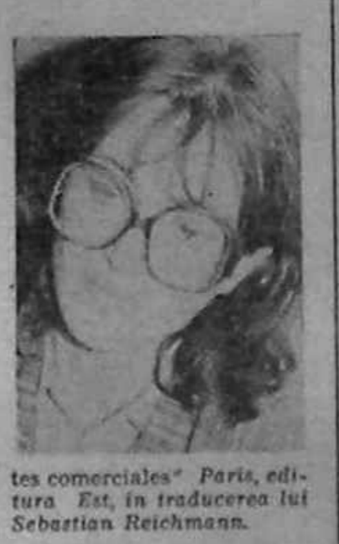
tes comerciales” Paris, editura Est, în traducerea lui Sebastian Reichmann.